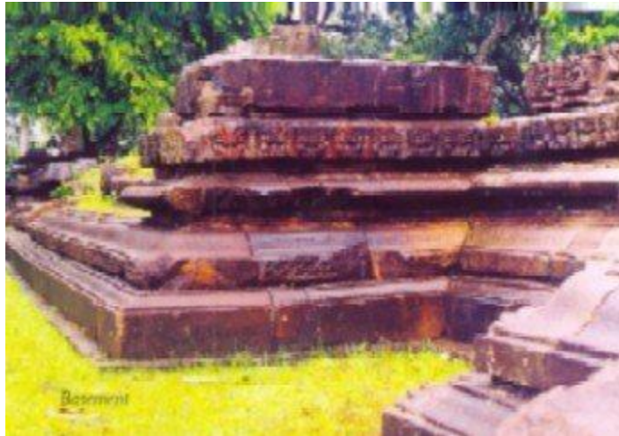
Sculpture, Madan Kamdev Temple