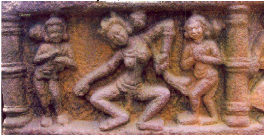
Sculpture, Madan Kamdev

Perhaps there is no place in India except Khajuraho and Kanarak, where basic weaknesses of mortals caught in fear, doubt, love, jealousy and consummate passion have been so eloquently expressed. It is really a mystery, how Madan Kamdev, a place exquisite antiquities, so near to