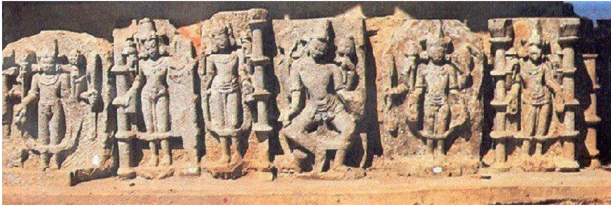
Sculpture, Madan Kamdev