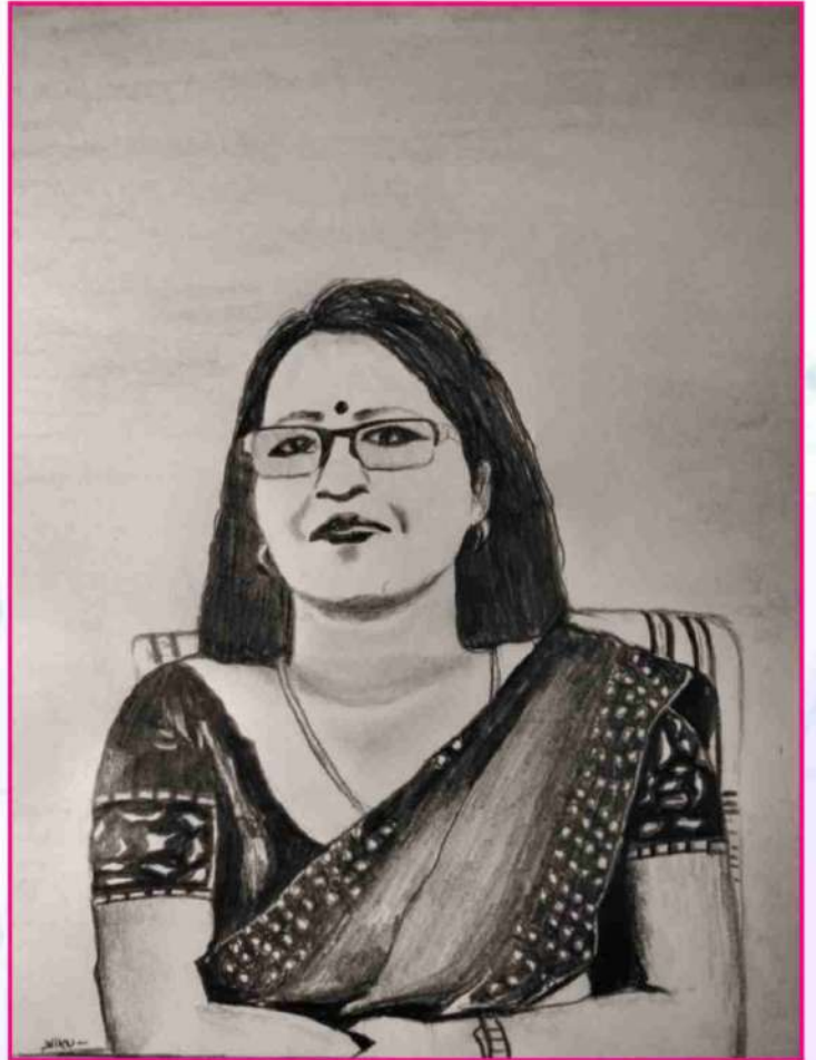
Art by Nikumani Rajbangshi (Ex student)