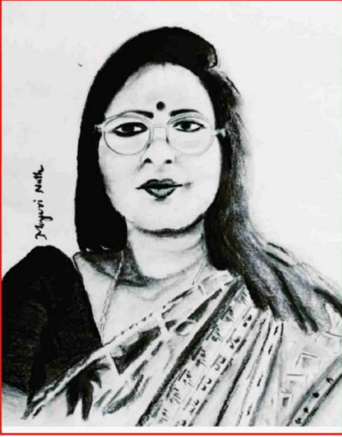
Art by Mayuri Nath (Ex Student)