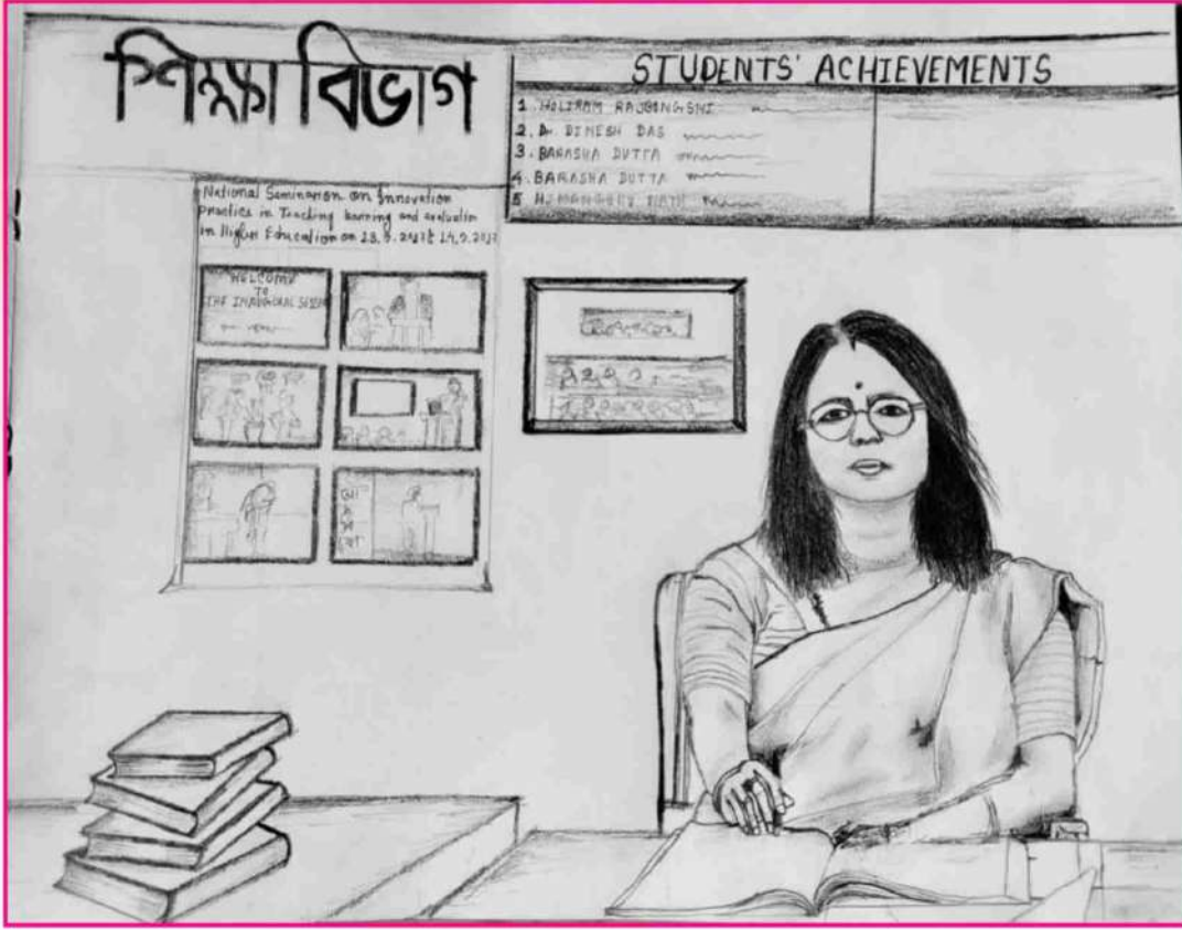
Art by Mrinmoyee Deka (Ex student)