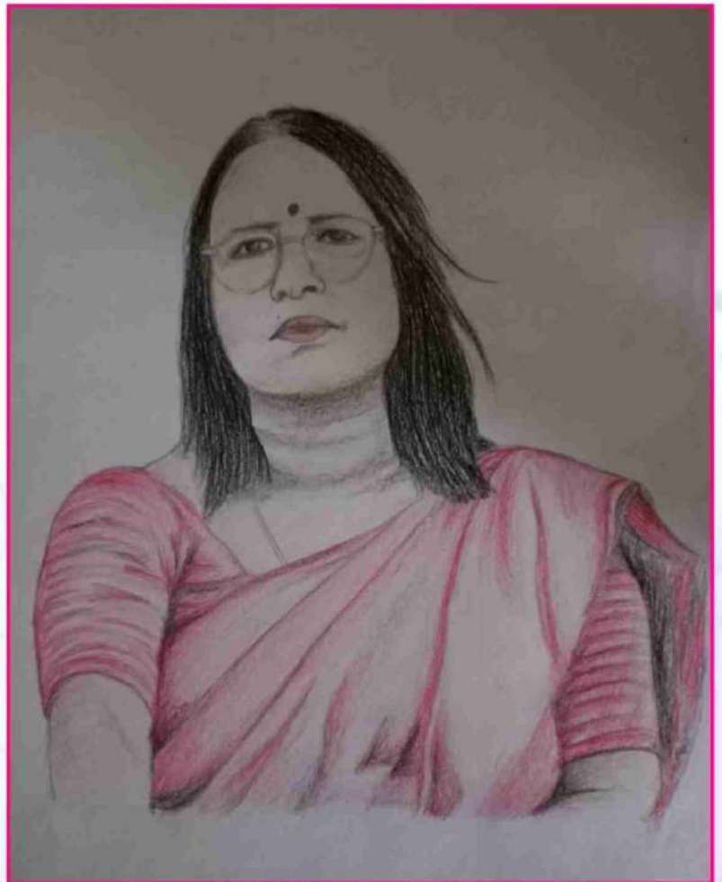
Art by Ashima Baruah (Ex student)